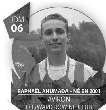
Mérite sportif Morgien 2017